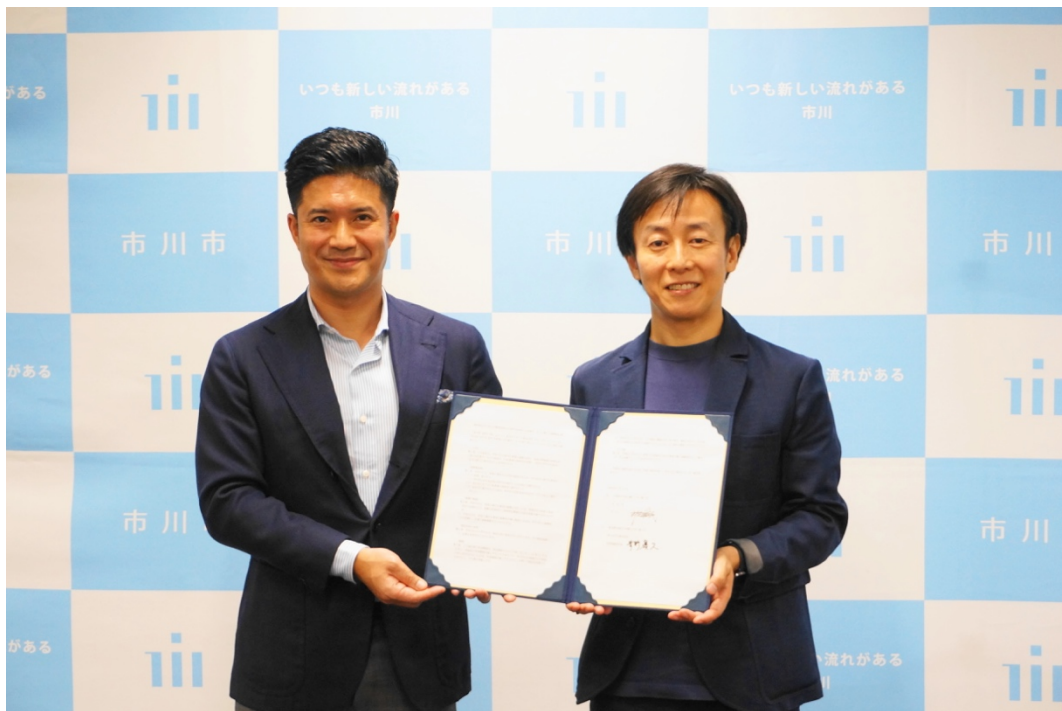
市川市とサイボウズの締結式の様子

あわせて、サイボウズは 2019 年 7 月 16 日、kintone 等を活用した住民サービス向上、全庁的な業務改善を目的に、市川市と連携協定を締結したことを発表いたします。