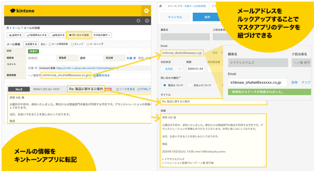
< kintone へのメール転記イメージ >