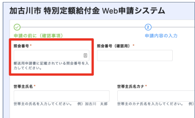
右：加古川市版オンライン申請フォーム

今回は緊急の対策ということから、市役所職員が数日間でフォームを作り上げ、kintone のセキュリティ機能を利用することで安全性を担保できています。