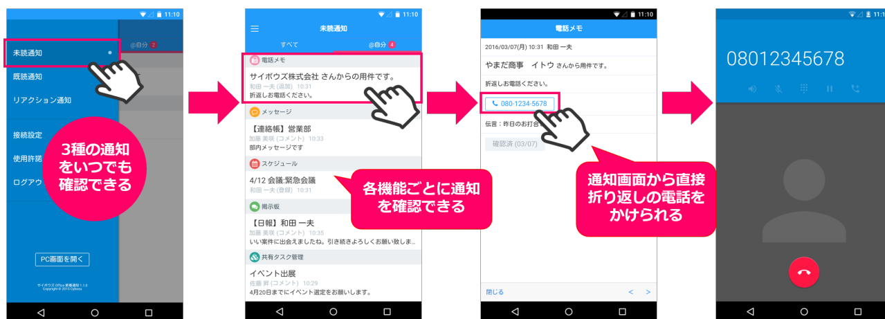
<「サイボウズ Office 新着通知」 利用イメージ>

サイボウズが独自に集計したユーザーアンケートによると、現在「サイボウズ Office」のユーザーの約2割がスマートフォンから「サイボウズ Office」を利用しています。サイボウズでは、今後もスマホからのグループウェア利用率が高まると考え、ユーザーがより便利に使えるよう、2015年11月より、専用スマホアプリ「サイボウズ Office 新着通知 for iPhone」をリリースいたしました。更に本日2016年4月11日よりAndroid版の提供も開始いたします。「サイボウズ Office 新着通知」最新版では、スケジュールやワークフローなどの新着情報をプッシュ通知で受け取れる機能に加え、電話メモの通知から直接架電する機能や、既読通知およびリアクション通知を確認できる機能を追加しました。