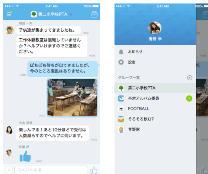
左：「サイボウズLive TIMELINE」タイムライン機能画面 右：「サイボウズLive TIMELINE」グループ一覧画面

「グループ」に「タイムライン」という機能を搭載。これまでは「グループ」を立ち上げた後に、メンバーとのやり取りのためには掲示板で新規トピックを作成しなければなりませんでした。今後は「タイムライン」上で、すぐにグループ内のメンバーと連絡を取ることができます。