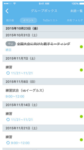
「サイボウズLive TIMELINE」 イベント機能画面

「タイムライン」上で生まれたアイデアがプロジェクトとして走りだすと、情報の整理、共有の必要性が高まります。従来より搭載している「イベント」「掲示板」「ToDo」「ファイル管理」機能も新アプリ上で利用できるため、情報を他のサービスに分散させずに、1カ所にまとめてプロジェクトを進めていくことが可能になります。