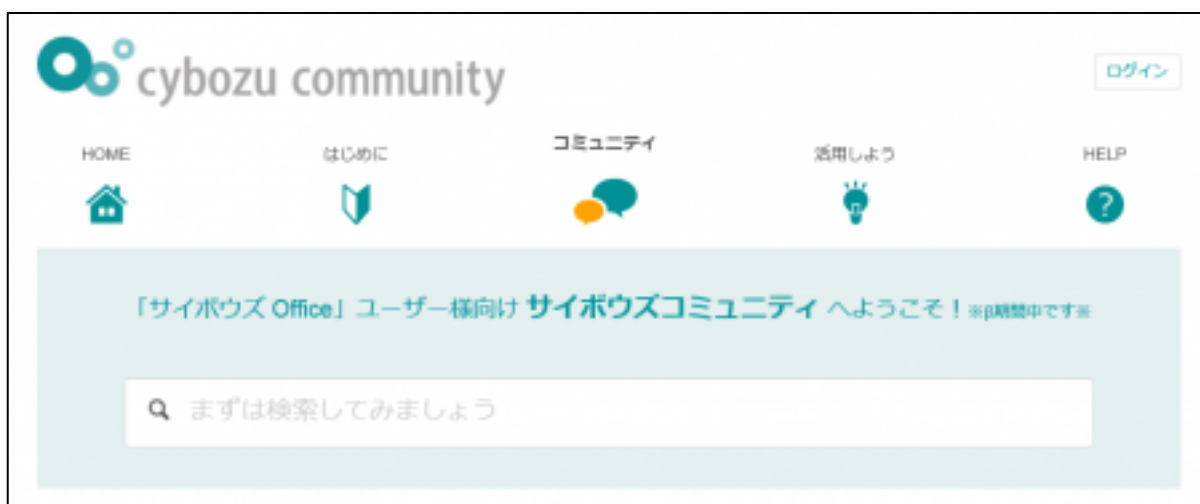
<cybozu community サイトイメージ>

「cybozu community」は、サイボウズ製品のユーザー様向け公式コミュニティサイトです。このコミュニティサイトは、ユーザー様同士のコミュニケーションを通して、「サイボウズ Office」に関する活用事例とノウハウの共有や、ちょっとした困りごとに対する自己解決の機会をユーザー様に提供します。今回「cybozu community」では新たな試みとして、チャット機能をテスト導入いたします。チャットサポートでは、コミュニティでの投稿方法やコンテンツ探しに関する質問にサイボウズが対応します。サイト訪問者の効率的なコミュニティ利用を助けます。